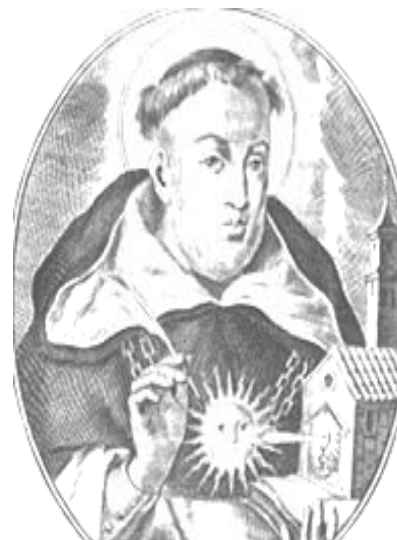
Sveti Toma Akvinski

Svetost ne znači puno znati ili puno razmatrati; velika tajna svetosti znači puno ljubiti.