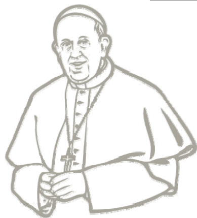
Papa nam govori

Pozornost je prema siromašnima u Evanđelju i u tradiciji Crkve; ona nije neki izum komunizma, i ne treba ju ideologizirati – tako je papa Franjo objasnio kontinuitet u crkvenoj tradiciji, u davanju prednosti siromašnima. Riječ je o pozornosti koja svoj izvor ima u Evanđelju – napomenuo je Papa te dodao da je zabilježena već u prvim stoljećima kršćanstva; dostatno je spomenuti prve crkvene Oce iz II. ili III. stoljeća. Njihove se propovijedi ne mogu opisati „marksističkima“ – objasnio je Sveti Otac – jer kada Crkva poziva da se pobijedi 'globalizacija ravnodušja', daleko je od bilo kakvoga političkog interesa i bilo koje ideologije. Potaknuta je jedino Isusovim riječima, i želi dati svoj prinos u gradnji svijeta u kojemu jedni druge čuvamo i jedni za druge se brinemo.